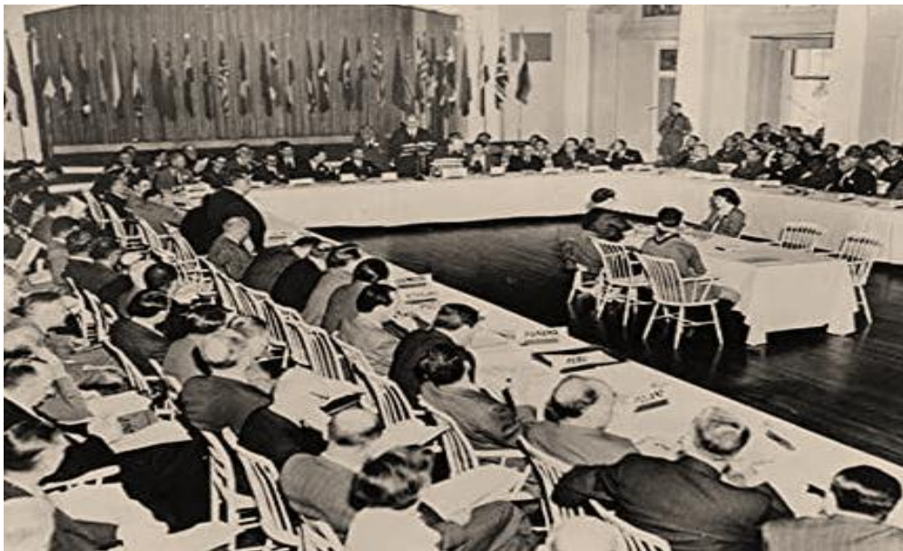
Figura 2. Conferencia Monetaria y Financiera de las Naciones Unidas 1944

internacionales que emergieron de los Acuerdos de Bretton Woods producto de la Conferencia Monetaria y Financiera de las Naciones Unidas que se realizó entre el 1 y el 22 de julio de 1944 (figura 2), en el complejo hotelero de Bretton Woods Nueva Hampshire Estados Unidos.