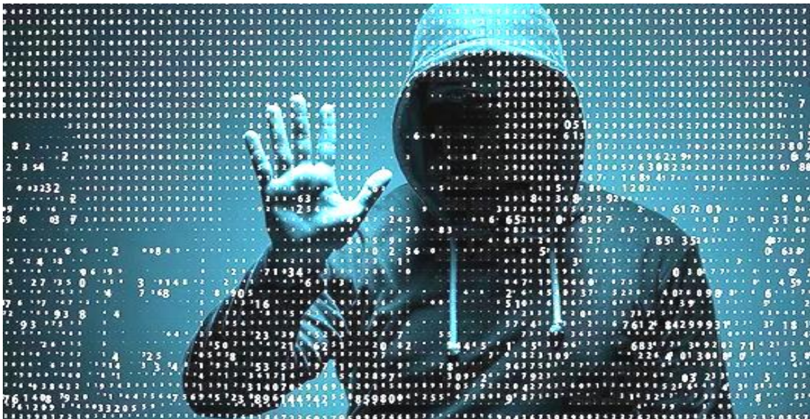
Figura 1: Representación simbólica del Ciber espionaje.

Desde el anuncio de la Organización Mundial de la Salud – OMS de la existencia de una Pandemia por Coronavirus, los países con laboratorios avanzados iniciaron carrera para ser los primeros en lograr tratamientos y vacunas y comercializarlos a nivel mundial. Desde entonces se han activado diversas teorías conspirativas asociada al ciber espionaje (figura 1)