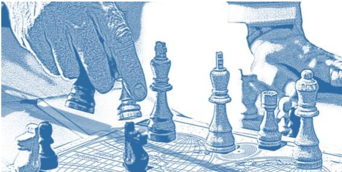
Figura 5. Política Internacional: Entre el Realismo y el Idealismo.

de las relaciones internacionales, la cual es una escuela de pensamiento cuyo objeto ontológico son los intereses subyacentes que orientan las relaciones internacionales de los Estados; en oposición a la teoría idealista (ver figura 5)