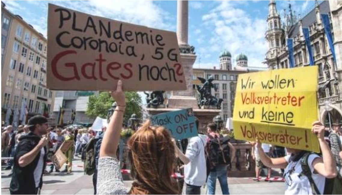
Figura 3. Protesta por el Confinamiento.

El periodista alude en este artículo a una conferencia realizada en la ciudad de Vancouver, Canadá(2015) donde Bill Gates, subió a un escenario, empujando una carretilla que llevaba un barril negro con los sellos del Departamento de Defensa de Estados Unidos. No obstante, en esa conferencia , él no se refería a un ataque atómico, sino a lo que consideraba sería la próxima gran amenaza mundial: “una pandemia causada por un virus altamente infeccioso que se propagaría rápidamente por todo el mundo y contra el cual no estaríamos listos para luchar.”