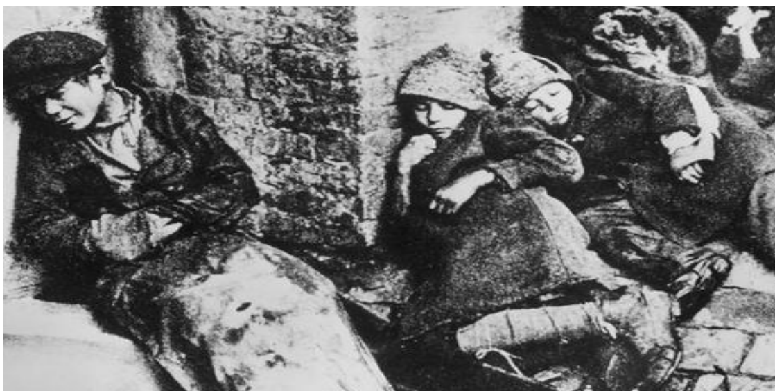
Figuras 6. Hambruna que azotó a la Republica Socialista Soviética de Ucrania durante el periodo 1932 – 1933.

Estas tácticas tienen como propósito provocar en la República Bolivariana de Venezuela una situación análoga al Holodomor (matar de hambre), también conocido como el genocidio ucraniano que es como se conoce a la gran hambruna que azotó a la Republica Socialista Soviética de Ucrania durante el periodo 1932 – 1933 (figura 6), donde se estima que murieron más 3.941.000, debido a las políticas que adoptó Stalin contra los Kulak que eran los agricultores de la Rusia zarista que poseían la tierra y que eran considerados como terratenientes, aunque posteriormente esta expresión fue utilizada para referirse a todos los propietarios agrícolas que se oponían a la colectivización.