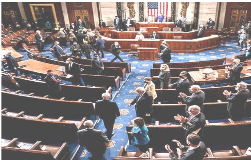
Figura 1. Imagen del Congreso de los EE.UU

Dicha expresión, en principio alude a la teoría liberal del presidente norteamericano Woodrow Wilson expuesta el 8 de enero de 1918, ante el Congreso de los Estados Unidos (Figura 1), resumida en 14 puntos estratégicos con el objeto de poner punto final a la Primera Guerra Mundial y crear una Sociedad de Naciones que se tutelara por pactos y convenios internacionales y principios de cooperación sobre la base de la desaparición de las barreras económicas.